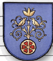
Männergesangverein Lödingsen von 1892 e.V.