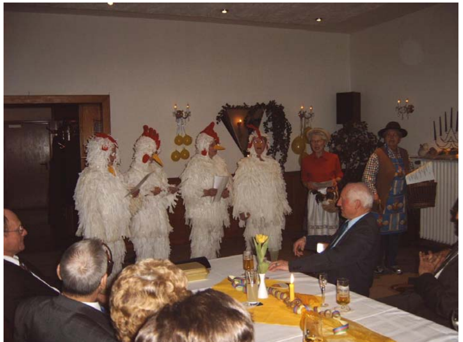
Die Girls vom Verein mit: „Der Eiermann und die Eierfrau mit ihren 4 Hühnern.“