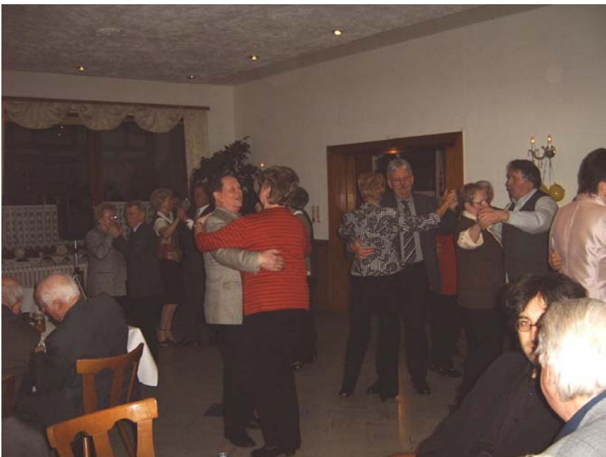
Es wurde recht viel getanzt