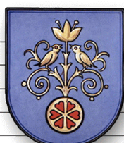
Männergesangverein Lödingsen von 1892 e.V.